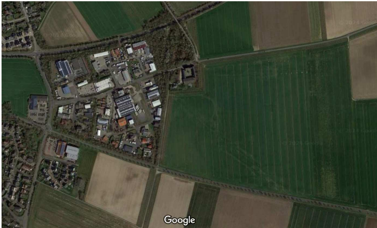
Luftbild vorhandenes Gewebegebiet und Flächen für das Industriegebiet H3

Das wird in den neuen Industriegebiet nicht mehr stattfinden. Durch die großen Industrieflächen und Erschließungsstraßen wird nur noch eine Begrünung an der L 263 stattfinden.