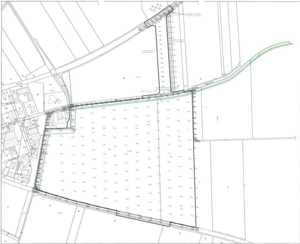
Abb. 5: Lage der artenschutzrechtlichen Maßnahmen für die Fortführung des Tagebaus Hambach

Bei Umsetzung der Planung würden diese artenschutzrechtliche Maßnahmen für die Fortführung des Tagebaus Hambach wertlos. Vergleichbare Nahrungshabitate sind für die Fledermäuse des Nörvenicher Waldes in der Nähe nicht vorhanden.